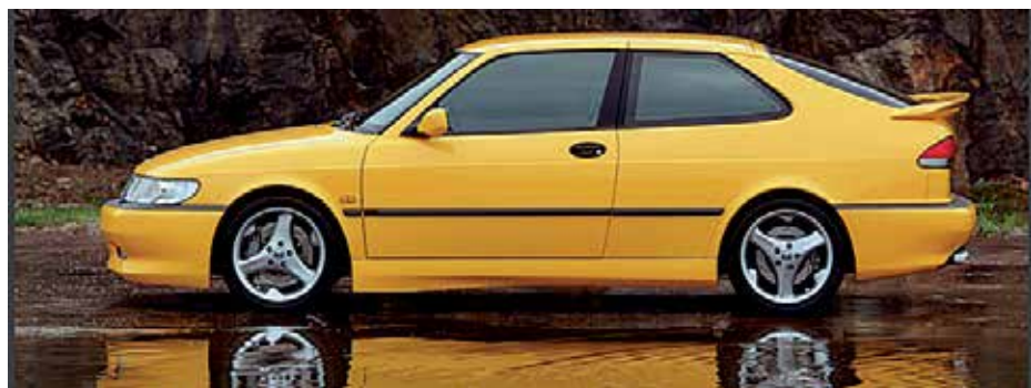
Saab 9-3 Viggen