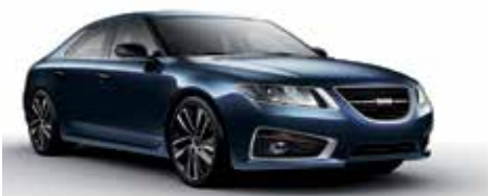
Saab 9-5 Aero 2012

Medlemsavgift år 2015 350 kr Familjemedlem: 100 kr PLUSGIRO: 476 52 46-6 ORG nr: 867200-6502