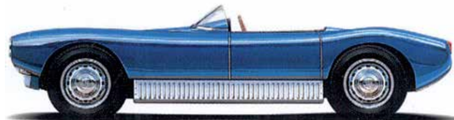
SONETT 1 – 1956

som fram till Saabs konkurs varit väldigt positivt. Idag har vi ett fortsatt gott samarbete med de nya ägarna.