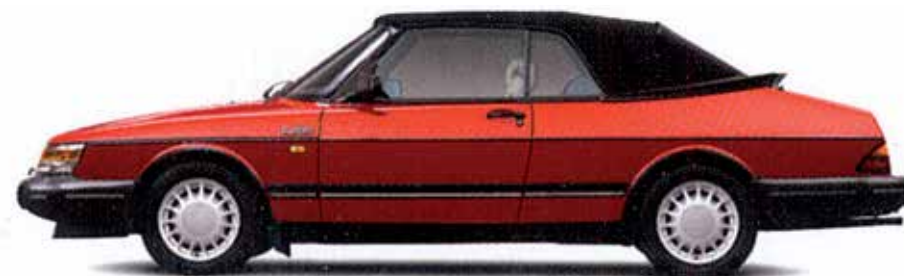
900 CABRIOLET – 1987

Till vänster ser vi en av flera informationsskrifter som MHRF ger ut och som behandlar bilhobbyn och denna gång gäller det vilka risker som finns med verkstadsarbeten och förvaring av fordon.