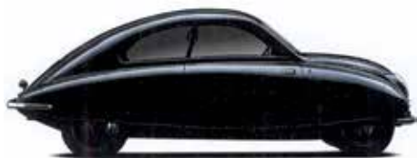
Urсаab 92 årsmodell 1947

Det finns ett antal lokalsektioner anslutna till Svenska Saabklubben, dessa är Saab Skånia, Norrland, Stockholm, Gothia (Göteborg), Gotland Karlskrona samt Trollhättan.